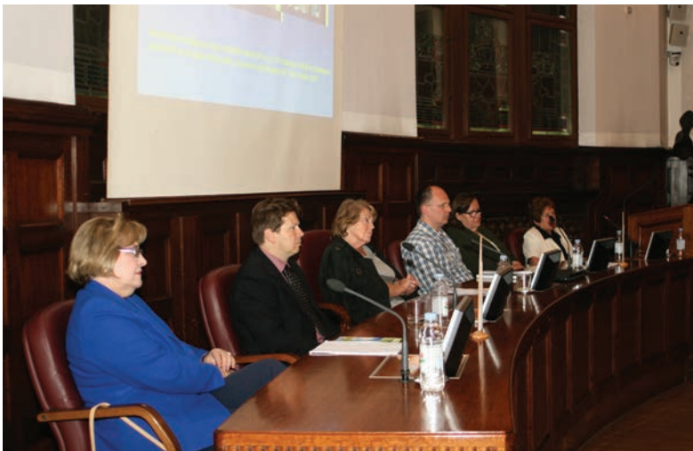
ISO FORUM -Zelena kemija u HGK-u (2014.)

kromatografiji, modeliranju kao i o međulaboratorijskim usporedbama (MLU). Tako Hrvatska akreditacijska agencija (HAA ) priznaje certifikate naše škole za akreditaciju laboratorija. Stvarali su se zajednički projekti.