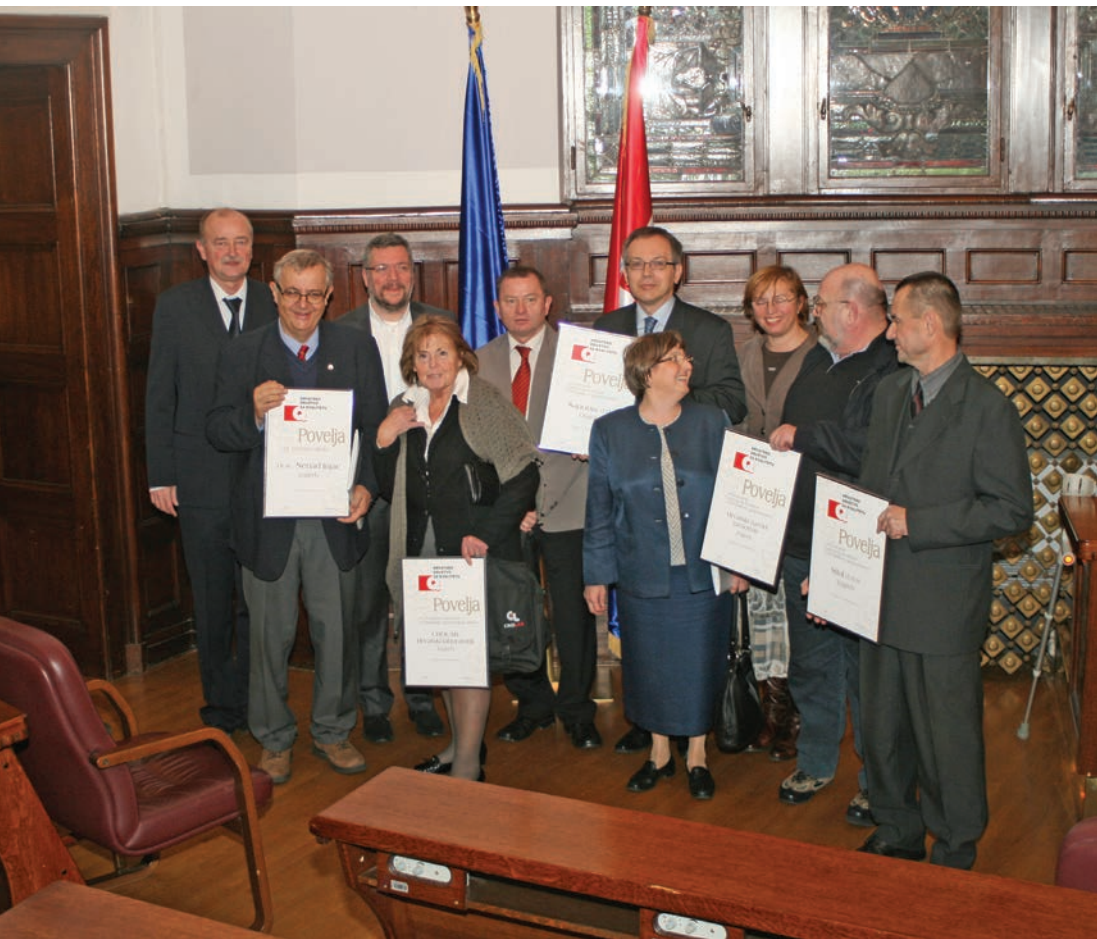
Povelja Hrvatskog društva za kvalitetu CROLAB-u (2012)