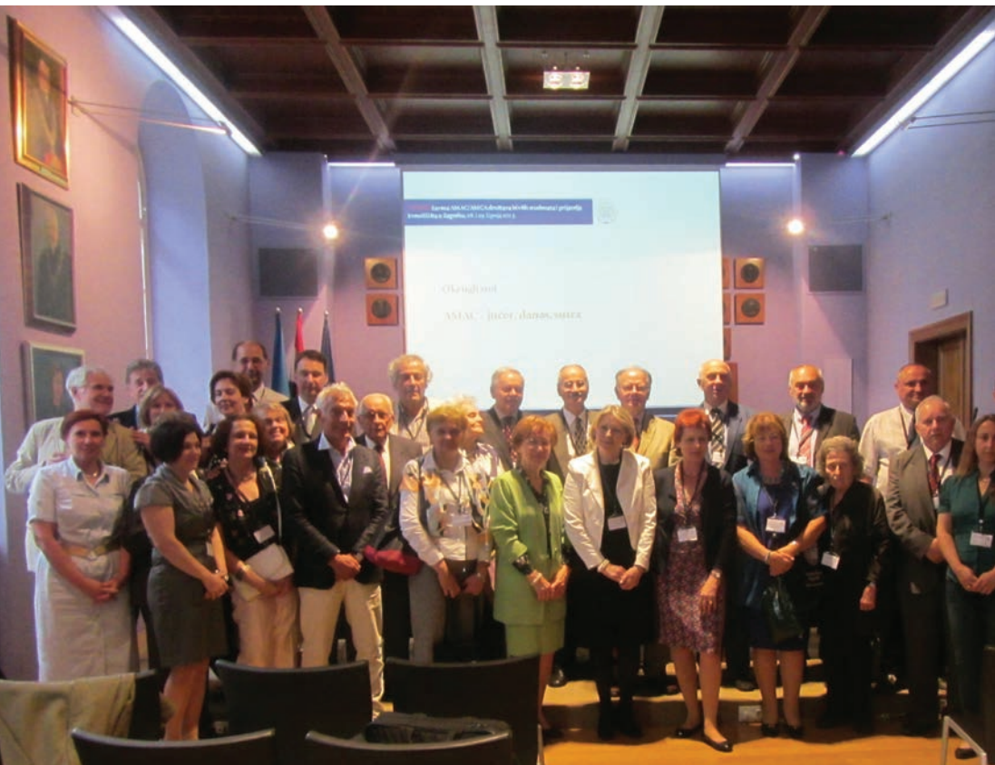
Sabor Saveza AMAC društava (2013)