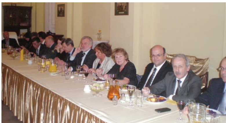
Predsjednica CROLAB-a na Generalnoj skupštini EUROLAB-a, Varšava (2013)